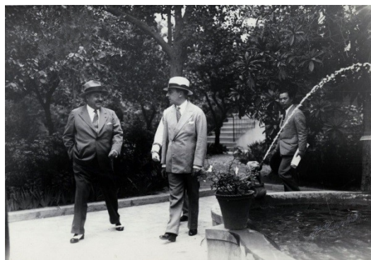
Beyrouth ? [ca 1936], Damien de Martel et Pierre Viénot, secrétaire d'État aux Affaires étrangères, négociateur des traités de 1936 (3AE/24)