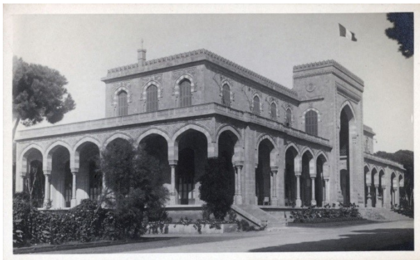
Beyrouth, la Résidence des Pins, siège du Haut-Commissariat de France en Syrie et au Liban (carte postale, 3AE/24)