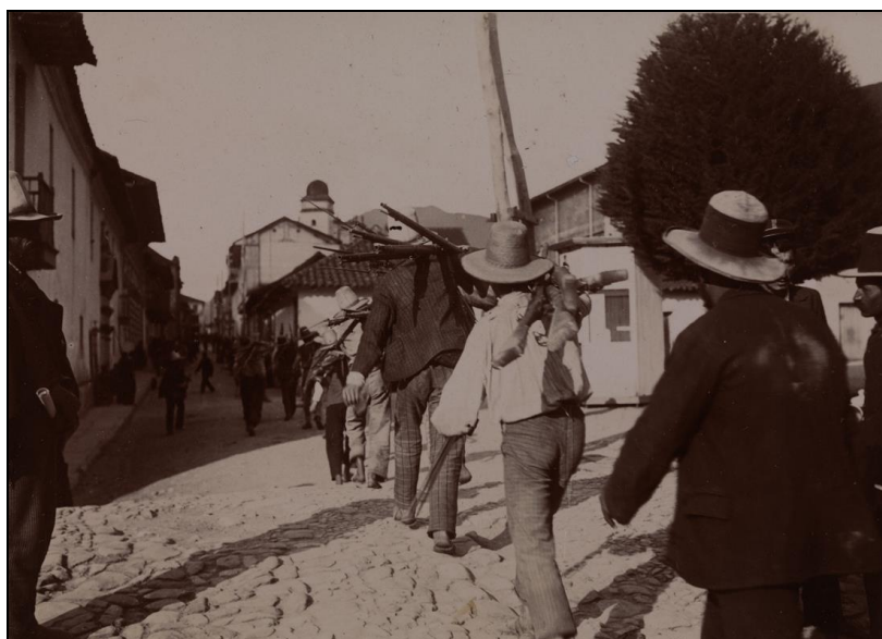
Bogota (Cundinamarca), hommes transportant des armes sur leurs épaules, de dos marchant à la file, 1899. ( Collection particulière ; Archives diplomatiques, photothèque : A047481 ).