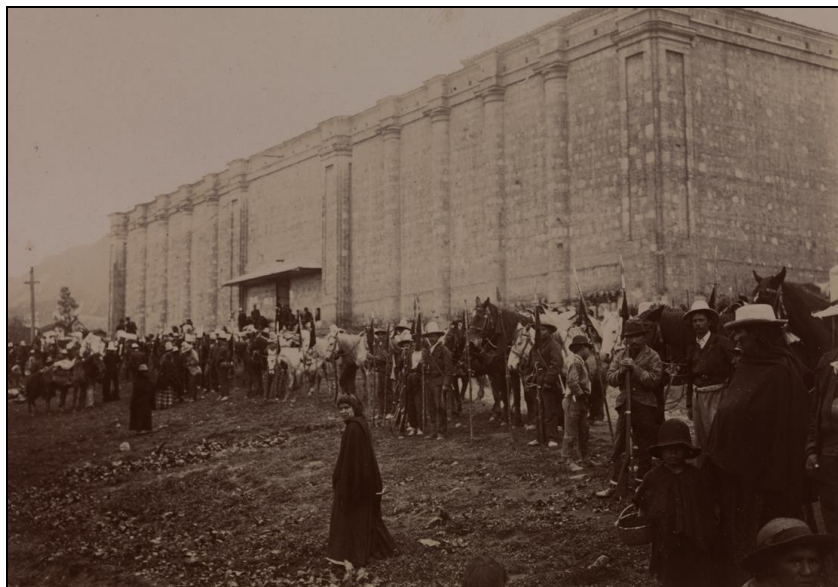
Bogota (Cundinamarca), vue d'hommes et de chevaux postés devant le Panoptico, prison de Bogota, 1899.