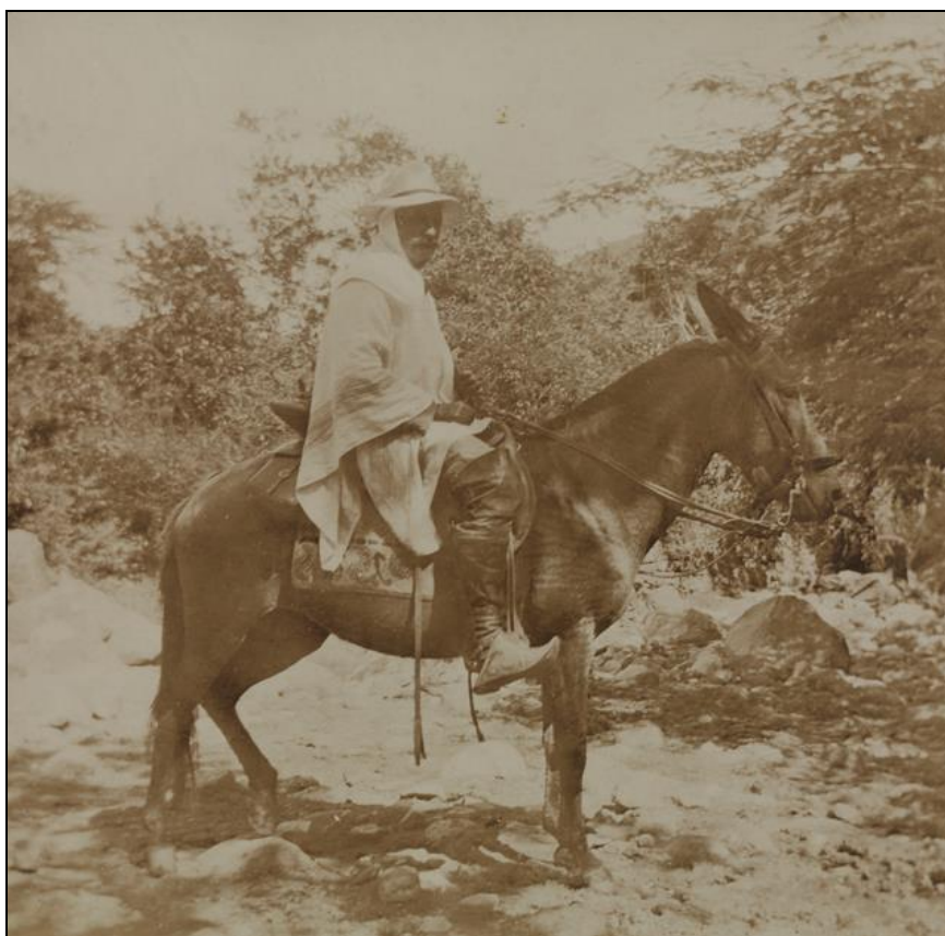
Ernest Bourgarel à dos d'âne, rio Socata (Boyaca), Colombie, 27 mai 1898.