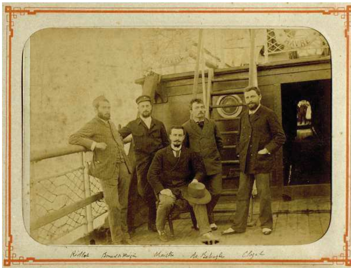
« La mission Maistre à bord de la Ville de Maceio »

[paquebot de la Compagnie des Chargeurs réunis, départ de Bordeaux le 10 janvier 1892] (7AE/26)