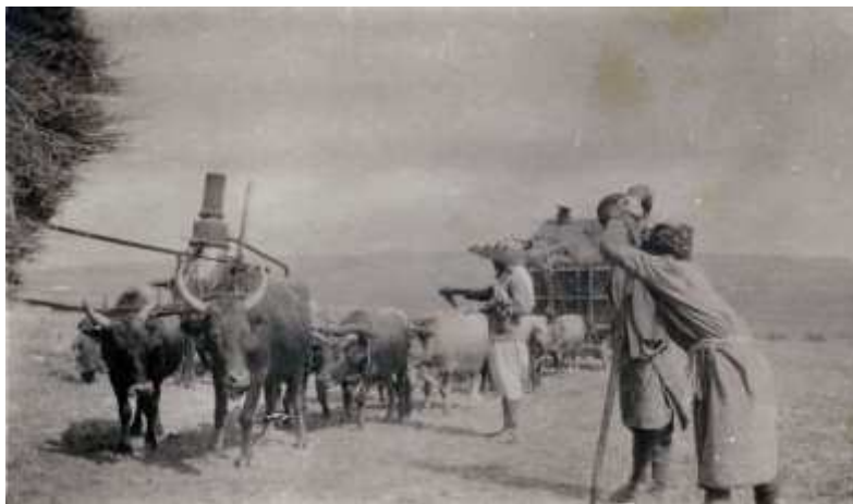
« Zafrane, les battages, 1928 » (6AE/6)