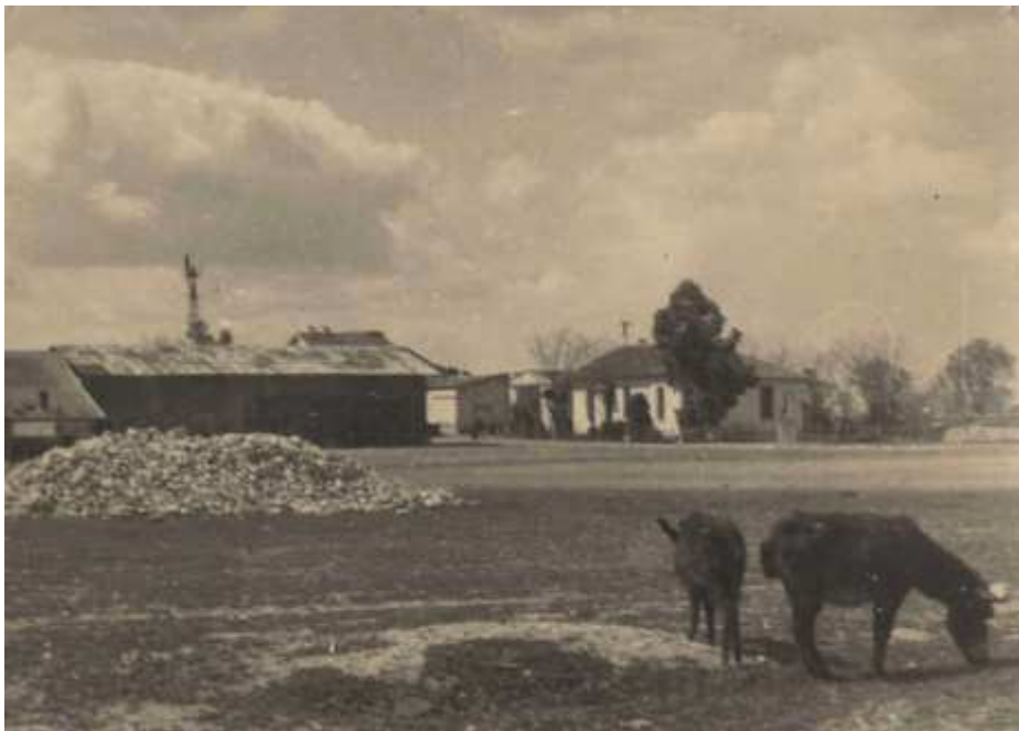
« Entrée de la ferme. Zafrane 1946 » (6AE/6)