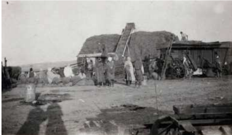
« Zafrane, les battages, 1928 » (6AE/6)