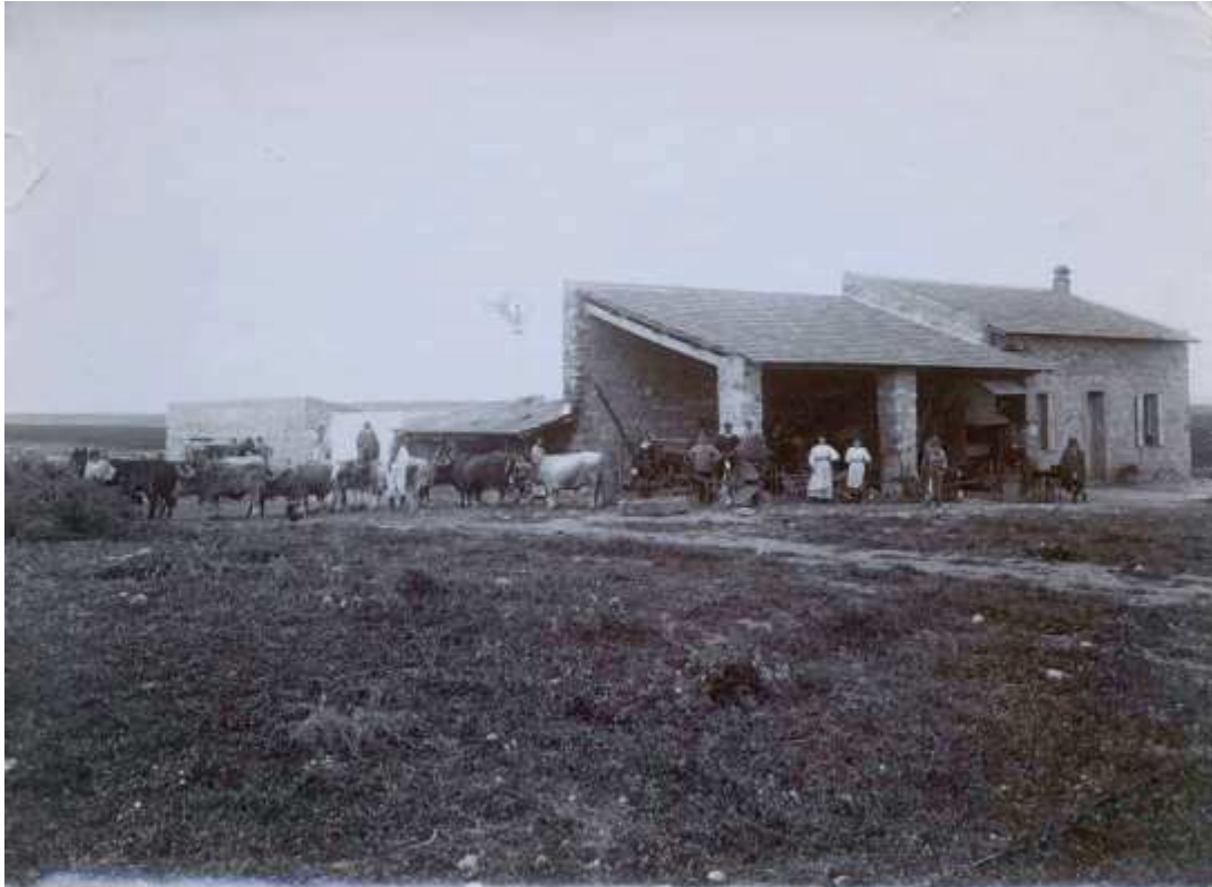
« Massicault, Ferme du Lyat. Cliché qui a servi à la carte postale », [mai 1909] (6AE/6) Henri Brunet se trouve au centre, debout devant le pilier gauche de l'appentis (casquette, barbe, col blanc).