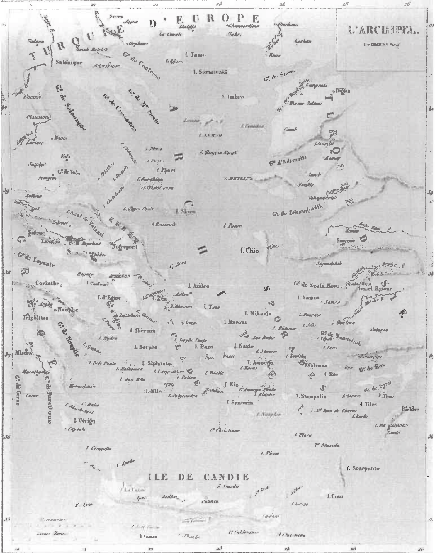
Carte de l'Archipel grec

(in Louis LACROIX, Iles de la Grèce , Paris, Ed. Firmin Didot frères, fac-similé : édition originale 1853)