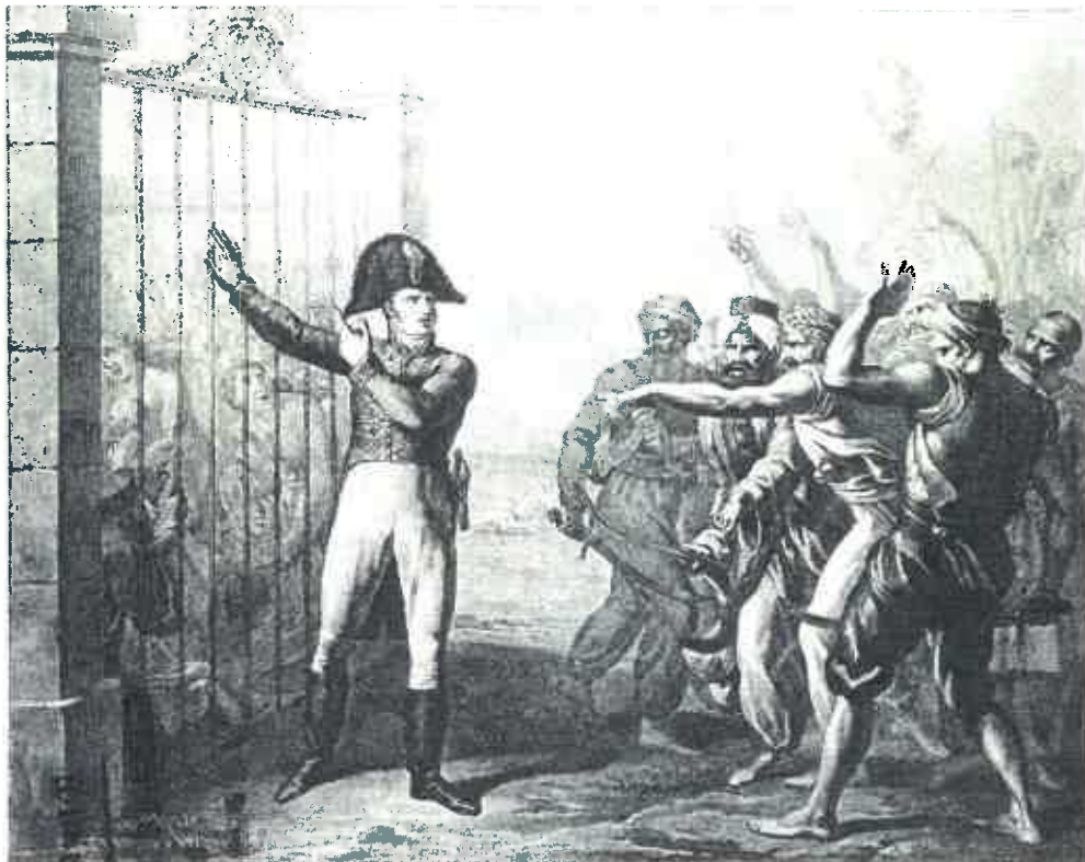
LE CONSUL DE FRANCE A SMYRNE PROTEGEANT LES CHRÉTIENS PENDANT LES ÉVÉNEMENTS DE GRECE