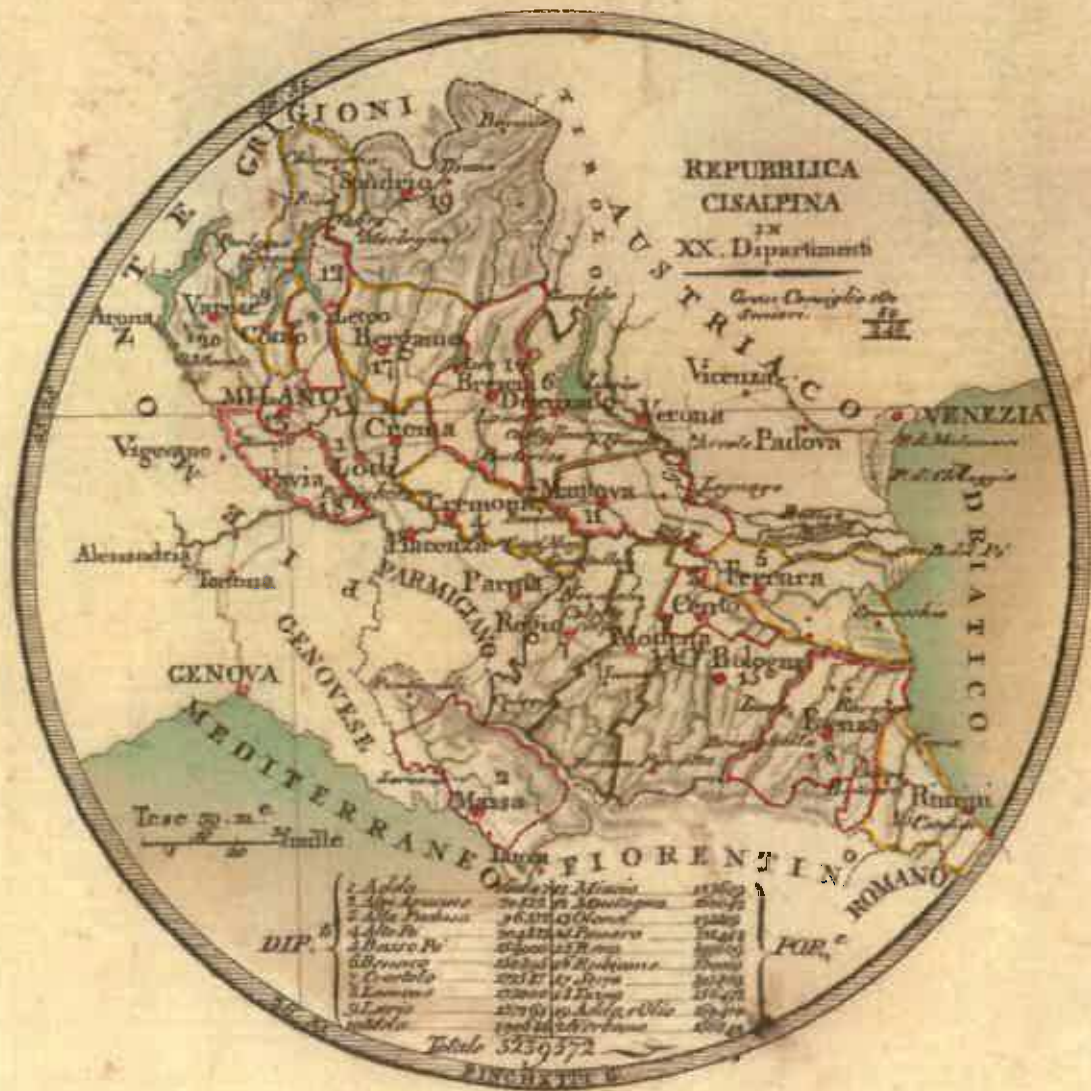
Carte de la République Cisalpine (1798) - Fonds Pierre David 1 AE 61/13